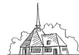
Evangelisch-Lutherische Kirchengemeinde Tonndorf